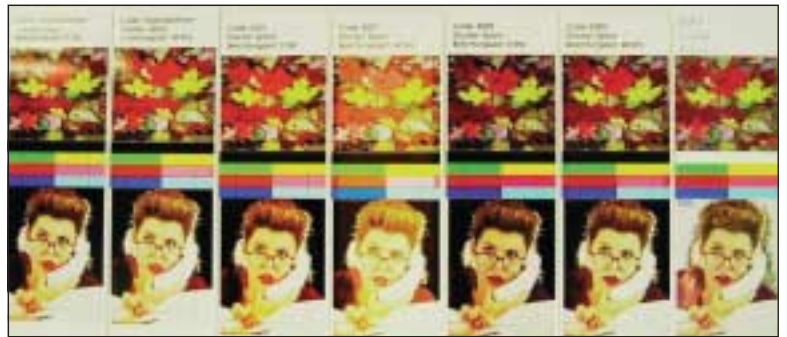
AUSLAUFEN UND AUSBLEICHEN: Nachgefüllte Patronen können beim Transport auslaufen. Spezielle Clips als Auslaufschutz gibt es ab zwei Euro. Die nachgefüllte Tinte blich in einigen Fällen bei simuliertem Sonnenlicht im Labor schneller aus als die Originaltinte. Die Druckqualität genügte in der Regel für private Nutzung.